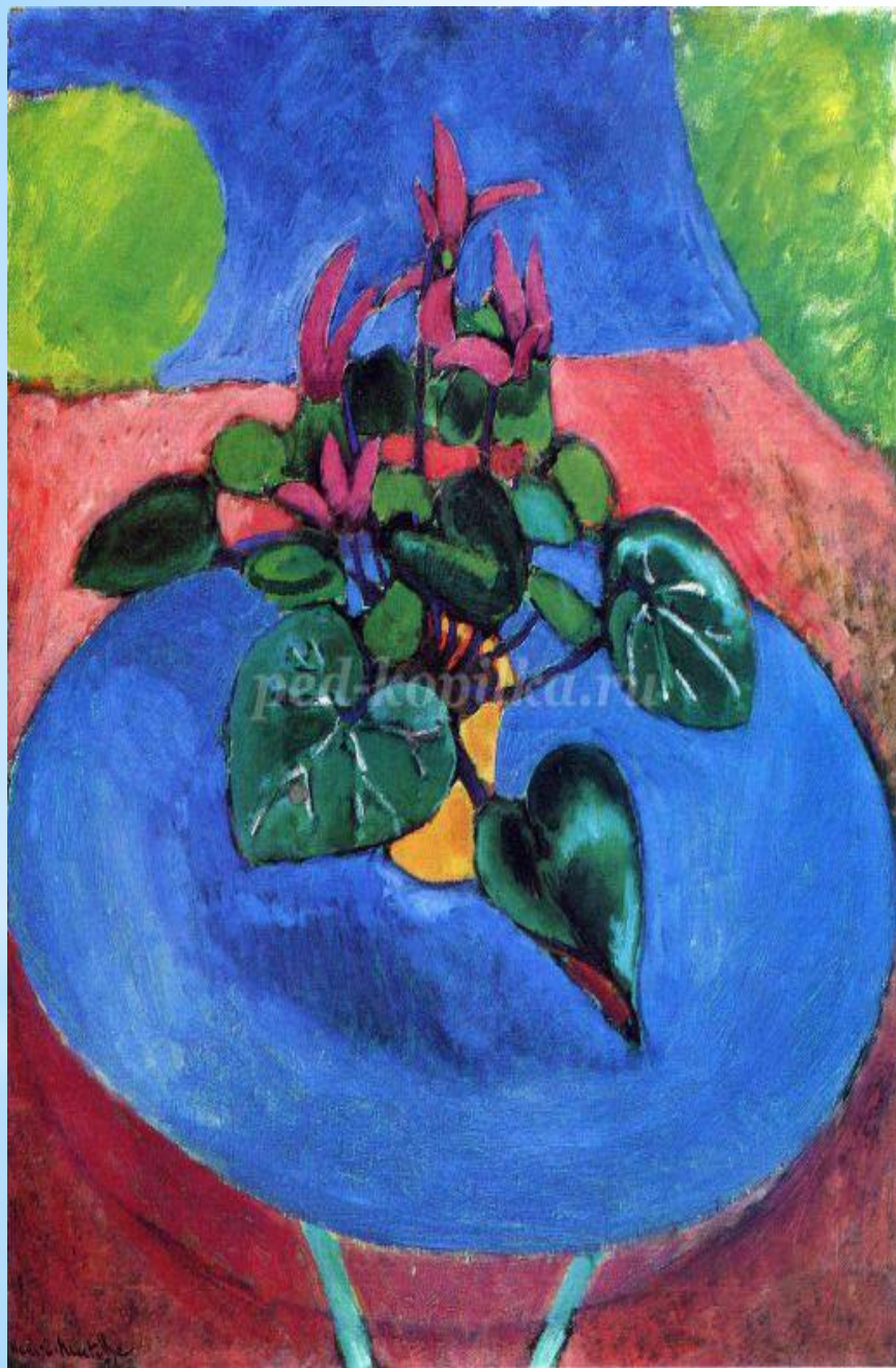
Анри Матисс (1869-1954) «Цикламен»