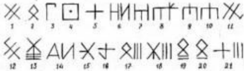
Коми пасы (родовые знаки), которые Стефан использовал для создания пермской азбуки «Анбур»