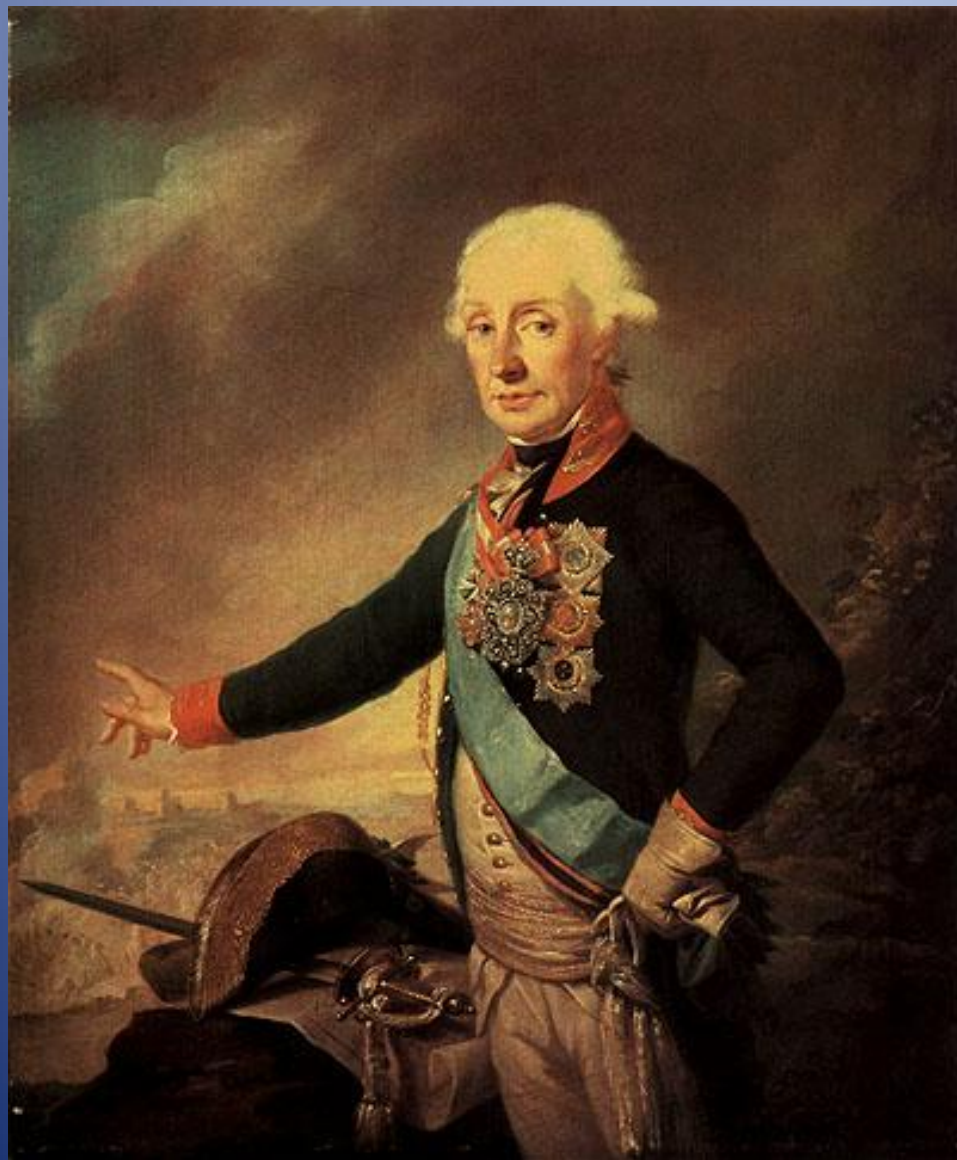
Портрет А. В. Суворова в мундире гвардейского Преображенского полка И. Крейцингер, .