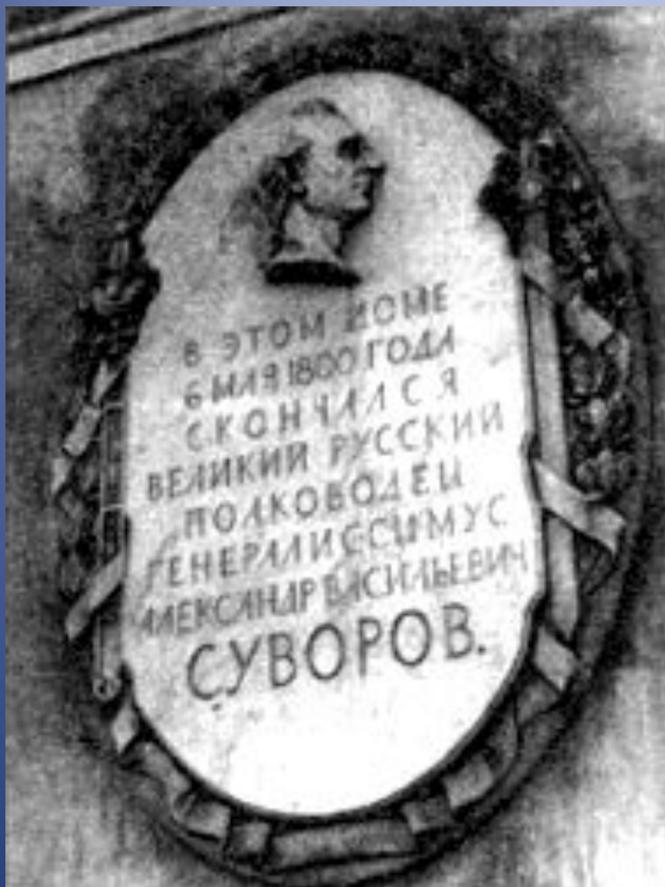
Мемориальная доска на фасаде дома на Крюковом канале, где скончался А.В. Суворов