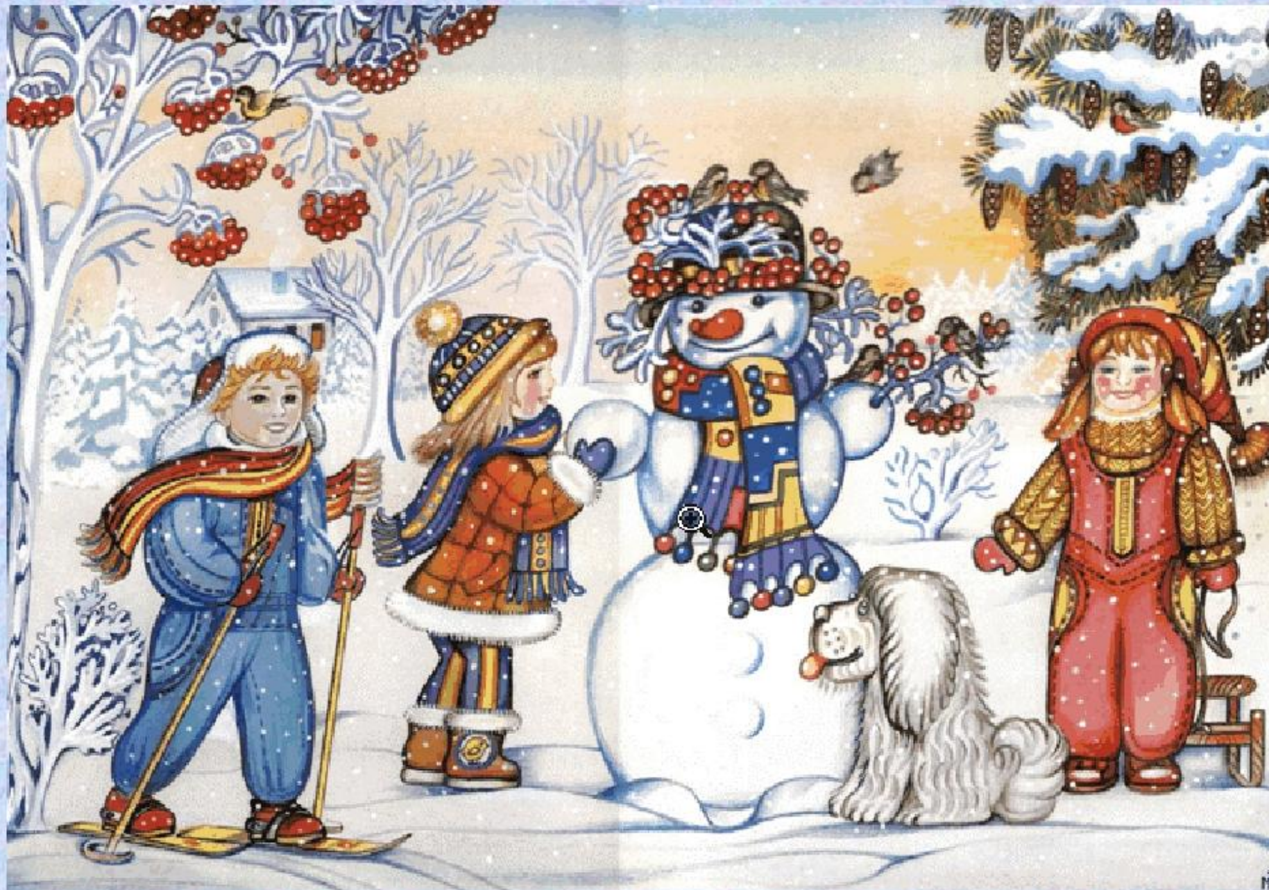
Картина М.Пишванова «В зимнем парке»