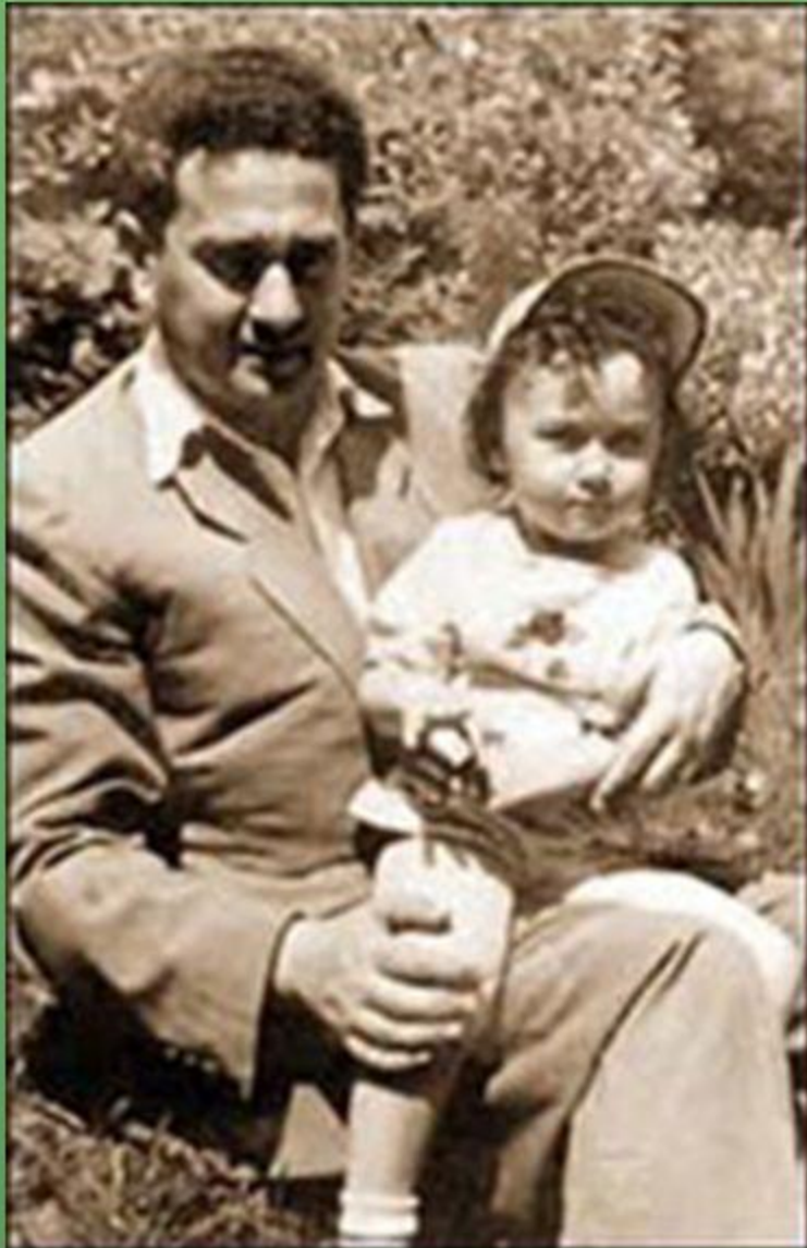
Виктор Драгунский с сыном

Главный герой жил рядом с писателем. Это был сын Виктора Юзефовича – Денис.