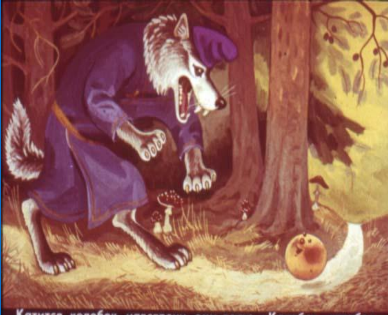
Катится колобок, а на встречу ему... Губы вытянуты вперед трубочкой «У-у-у-у»