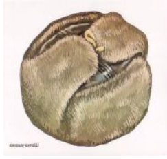
Шапка с мехом