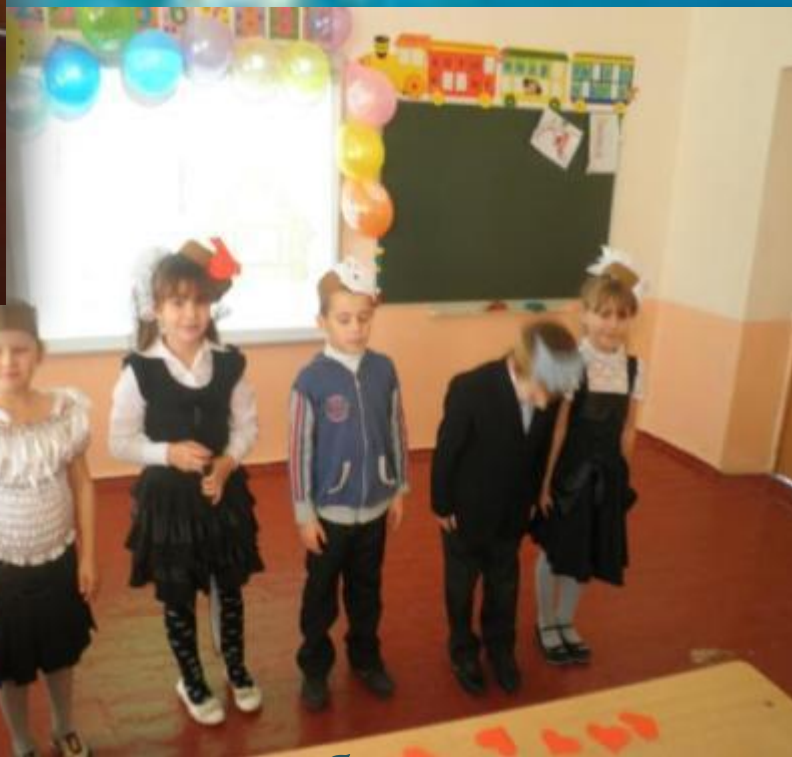
Инсценирование сказки «Заюшкина избушка»