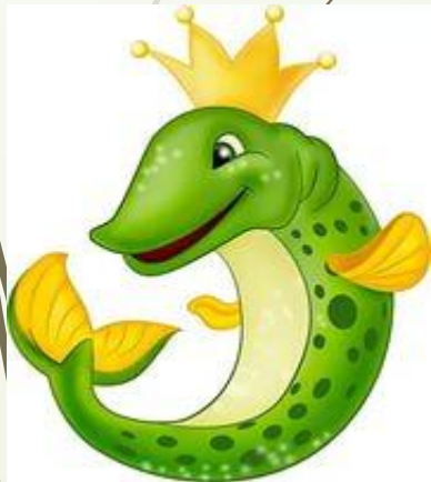
Щука из сказки Емеля