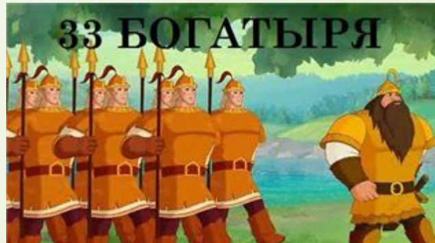
Тридцать три богатыря и дядька Черномор