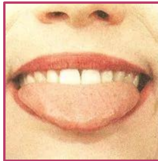
Накажем непослушный язычок