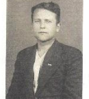
Мой дед видел победный салют над Ленинградом 27 января 1944 года. Он встречал Победу в мае 1945 г. Службу в милиции он закончил в звании майора в 1953 году.

Сам дед остался в осажденном городе. Он всю блокаду работал в милиции, Мародеры, дивертиры, спекулянты - они тогда жили в Великом Городе, но всеми силами стремились сломить его гордость, его мужество, огорчить его красоту, стеречь с лица земли один из красивейших городов мира. Эту фотографию мой дед прислал своей жене в Тайгу. Наверное, год 1942. Ему 30 лет. Под пиджаком - изящная рубашка (как тогда называли - исподнее). Недавно он похоронил своих отца и мать, выкопав их из-под. Но об этом писать нельзя - даже и свидетелям о смерти написано адекватная недостаточность.