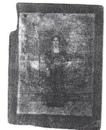
ЗУЕВА ВЕРА СЕМЁНОВНА ЛЕНИНГРАД. 15 ЛИНИЯ .Д. 72 кв. 12 ПОГИБЛА В БЛОКАДУ В 1942г.