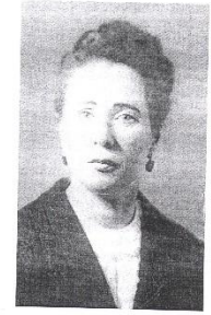
Родилась 31 октября 1932 года. Жила во время блокады на улице Жуковского, д. 33.