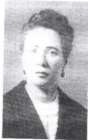
Родилась 31 октября 1932 года. Жила во время блокады на улице Жуковского, д. 33.