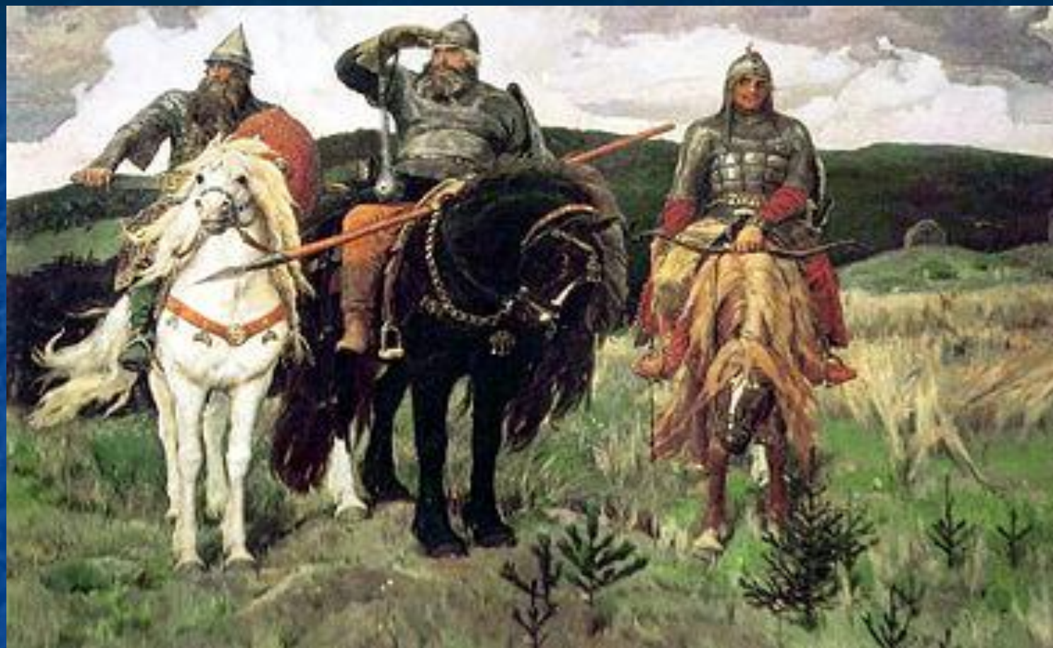
В.М. Васнецов «Богатыри»