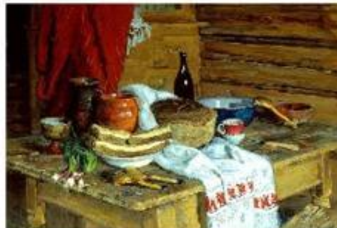
Натюрморт с хлебом