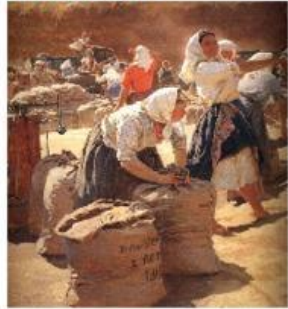
Татьяна Яблонская. Хлеб