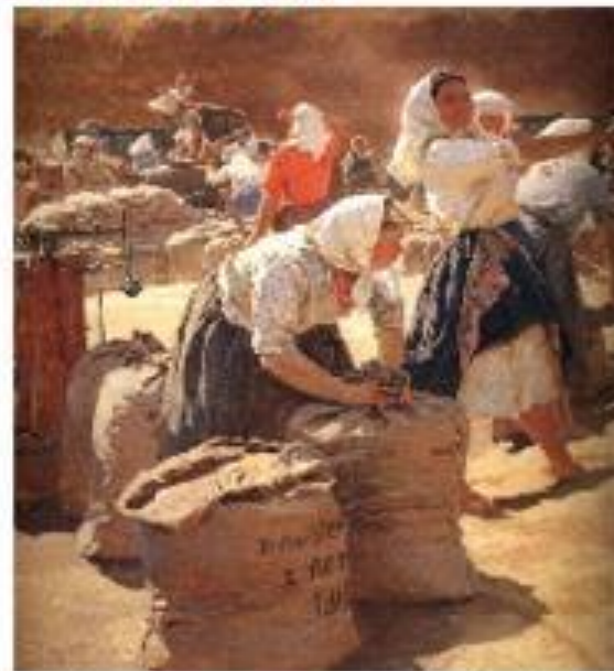
Татьяна Яблонская. Хлеб