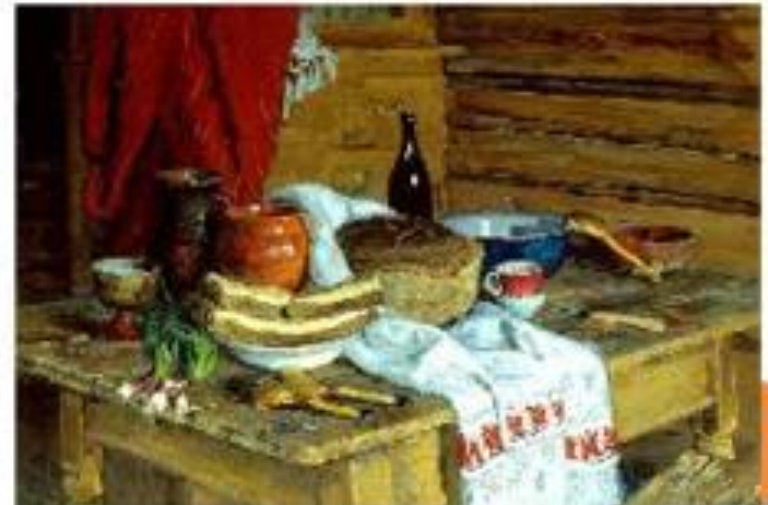
Натюрморт с хлебом