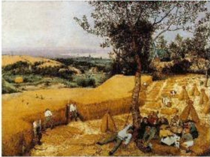
Брейгге Питер. Жнецы