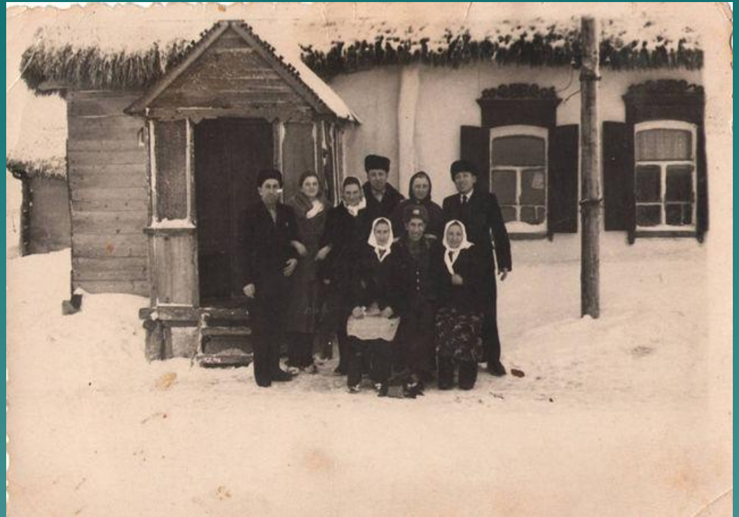
Ул Центральная Дом Новиковых

Нашему селу уже более 200 лет. Когда-то люди жили в избушках с соломенной крышей. В деревне не было ни света, ни газа. Еду готовили в печи, которую топили дровами. В домах горели лучины.