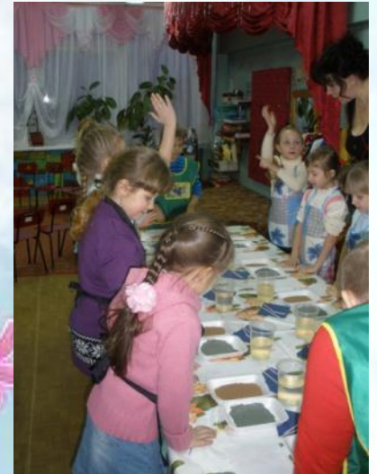
«Послание в будущее»