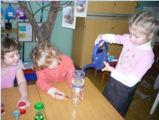
«Как работают водные часы?»