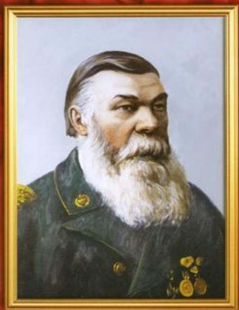
Яковлев Иван Яковлевич

Иван Яковлевич Яковлев — чăваш халăхн е çутта кăлараканĕ, çĕнĕ чăваш çырулăхне йĕркелекенĕ, чăваш букварьне тăваканĕ, Библие чăвашла куçараканĕ.