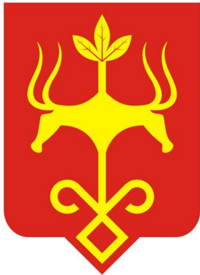
ГЕРБ ГОРОДА МАЙКОПА