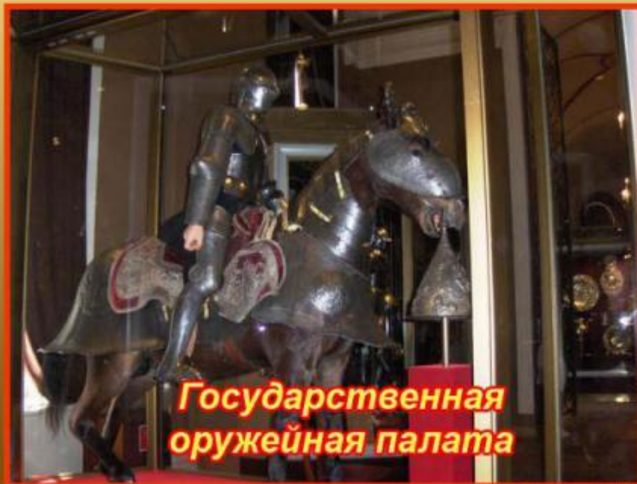
Государственная оружейная палата