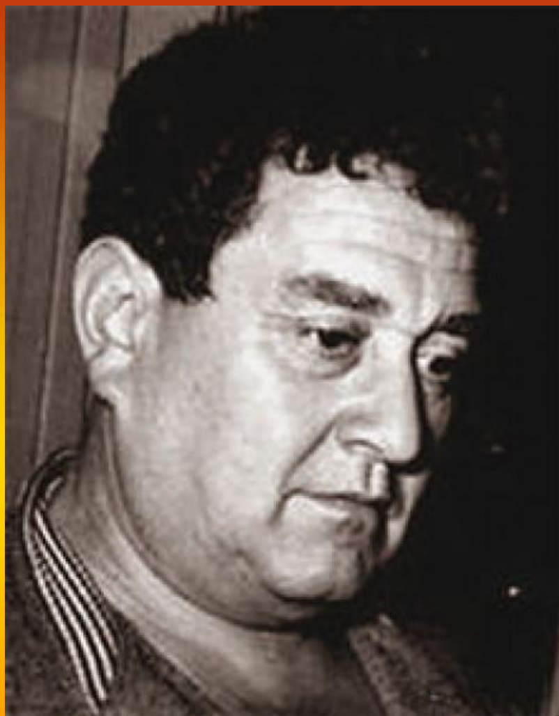
Драгунский Виктор Юзефович