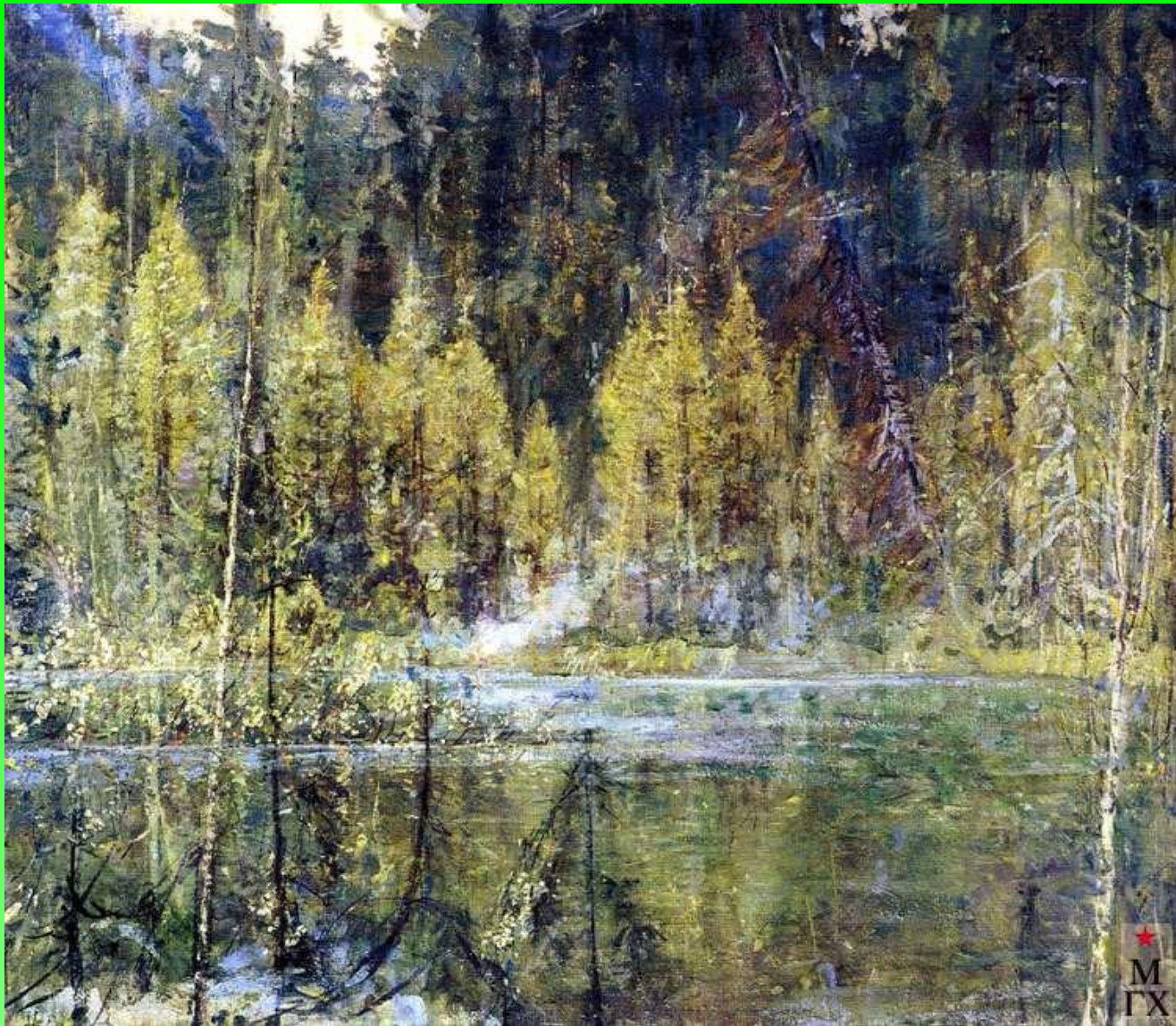
Кудинское озеро. 1974-1978