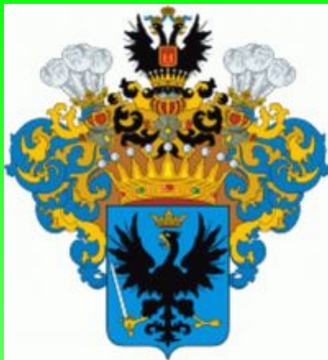
Герб рода Голенищевых-Кутузовых