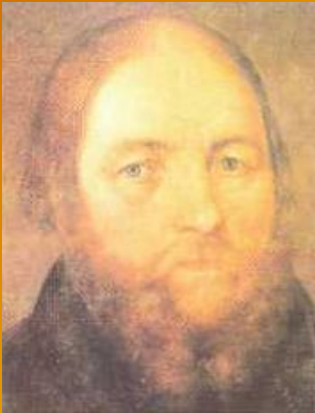
Портрет крепостного крестьянина Шарина. 1850-е гг. Худ. С. Юшков. Фрагмент