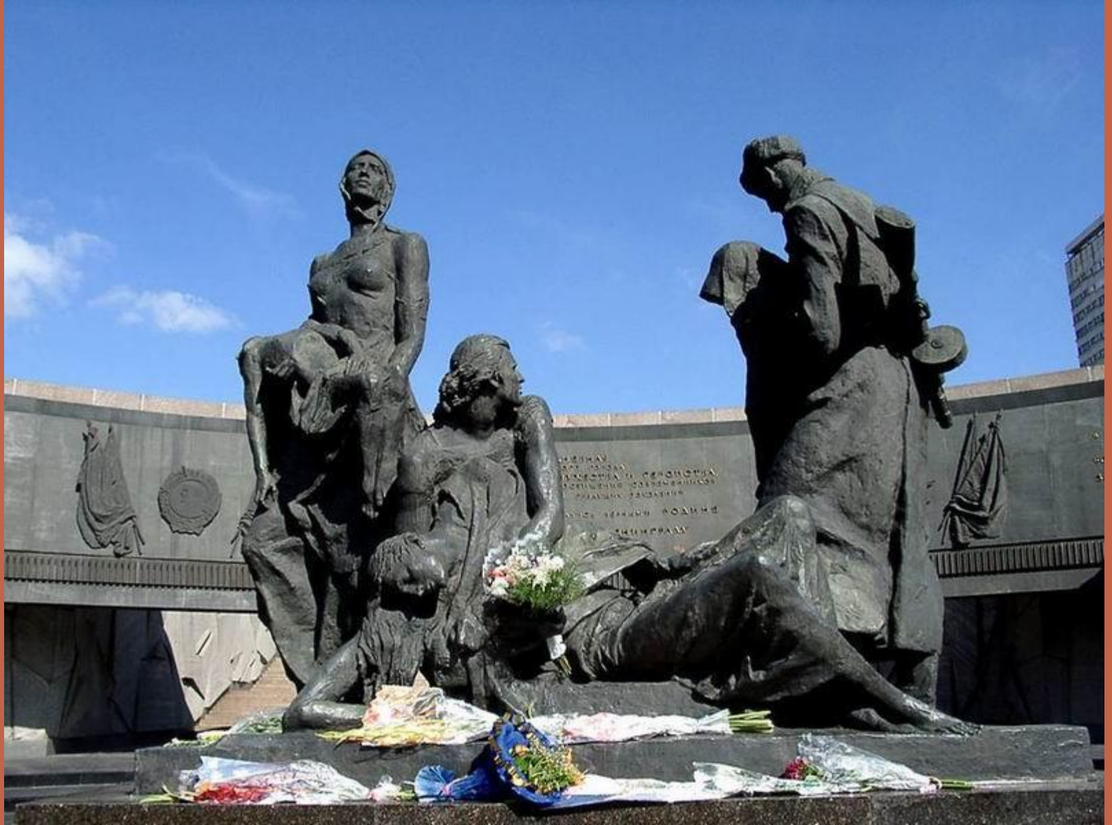
Мемориал защитникам Ленинграда