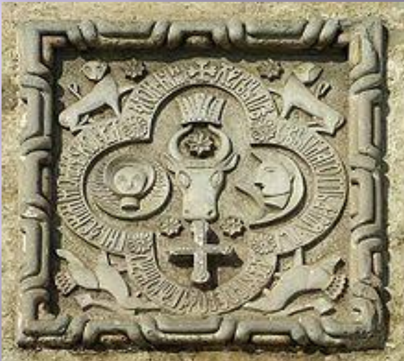
Герб Молдавии , высеченный на стене церкви в монастыре Четацуя в Яссах