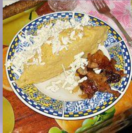
Мамалыга с брынзой и шкварками