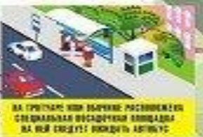
НА ТРОТУАРЕ НИКОГДА НЕ ПЕРЕКРЕЖИВАЙ СПЕЦИАЛЬНАЯ ПОСАДОЧНАЯ ПЛОЩАДКА НА НЕЙ СТОЯТ ПОКАЗЫ АВТОБУС