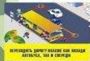
ВЕРИТЕСЬ, ДАЖЕ У НАС ЕСТЬ КОДА АВТОБАС, ТАК И СЕРВИС