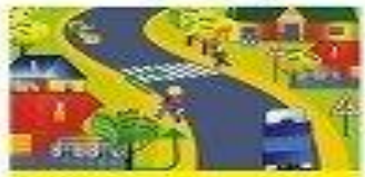
ВО ВРЕМЯ ДВИЖЕНИЯ СЛЕДУЕТ ИДТИ НАСТРЕЧУ ДВИЖЕНИЮ ТРАНСПОРТА