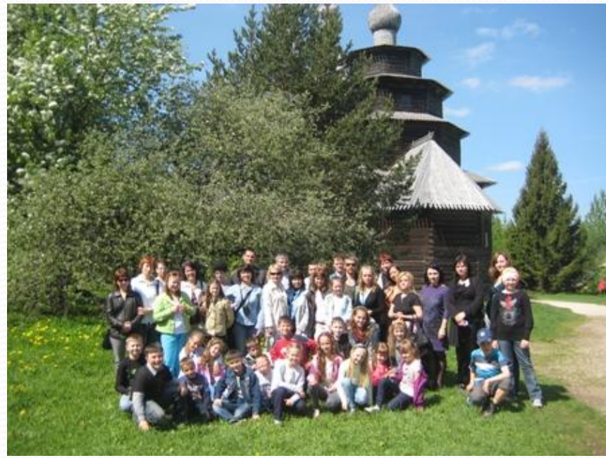
Новгород. Памятник деревянного зодчества.