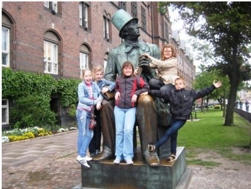
Копенгаген. Памятник Г.-Х. Андерсену