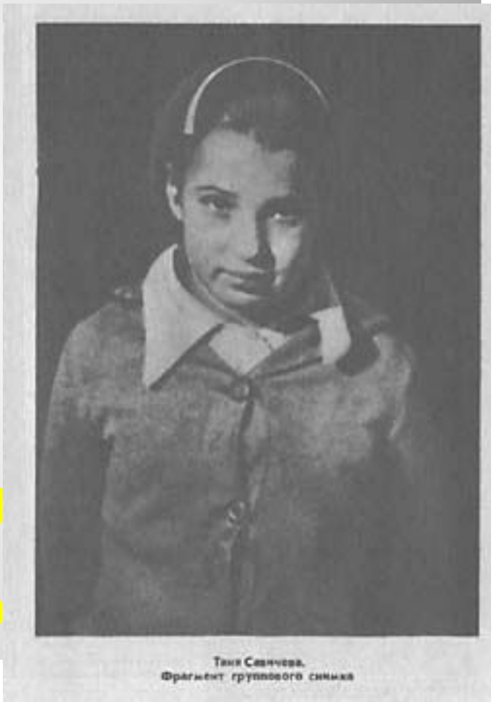
Таня Савичева. Фрагмент группового снимка