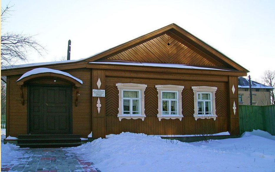
Город Арзамас дом на Новоплотинной улице.

Гостиная. Самая большая и светлая комната в доме. В воскресные дни вся семья собиралась за квадратным столом.