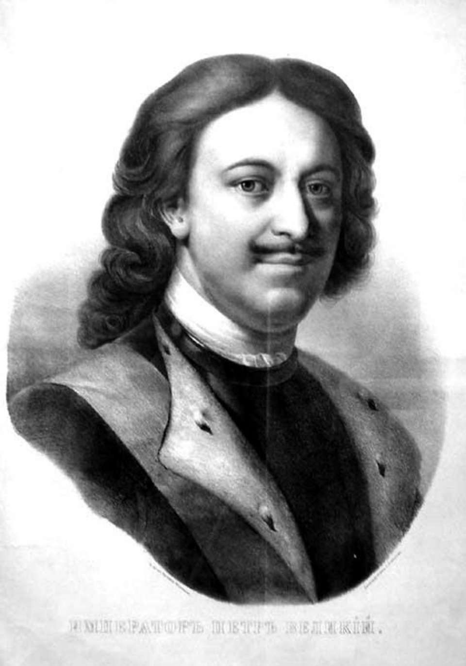
ИМПЕРАТОРЪ ПЕТРЪ ВЕЛИКІЙ.