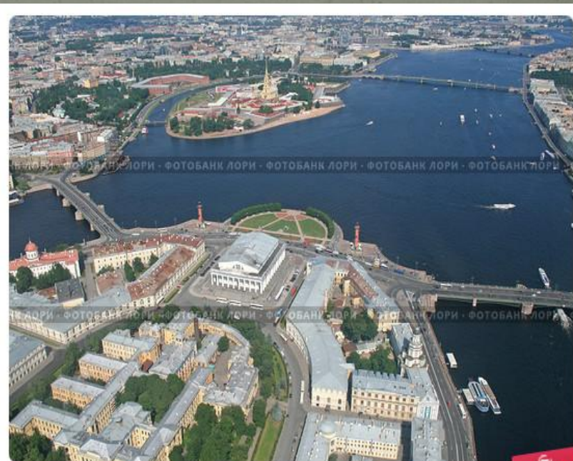
Петербург и невская акватория с высоты птичьего полёта. Стрелка Васильевская