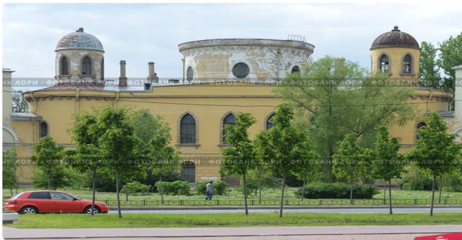
Чесменский путевой дворец. Санкт-Петербург

Чесменский путевой дворец находится недалеко от Московского проспекта и станции метро «Московская». Это здание похоже на средневековый замок.