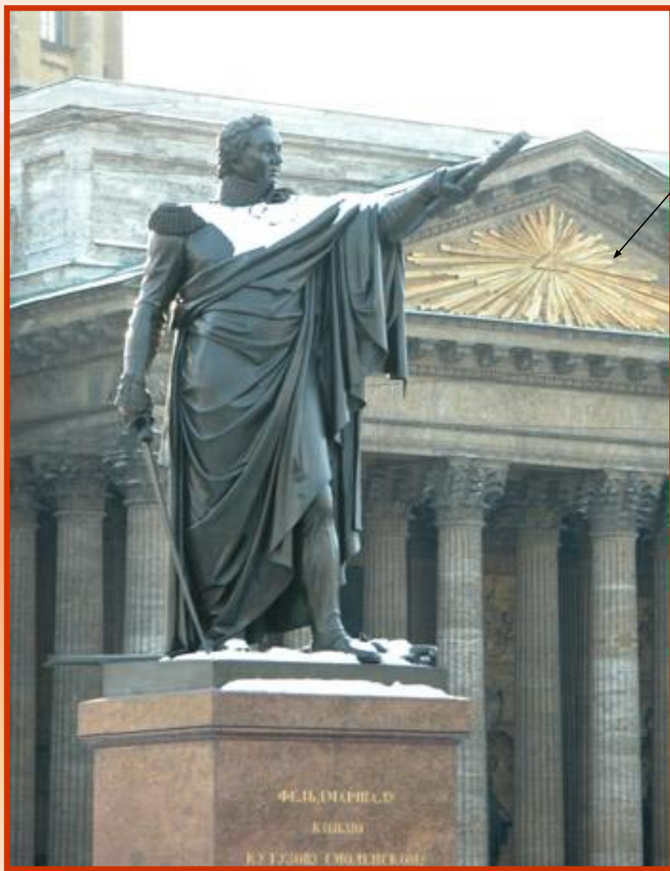
Рельеф «ВСЕВИДЯЩЕЕ ОКО»