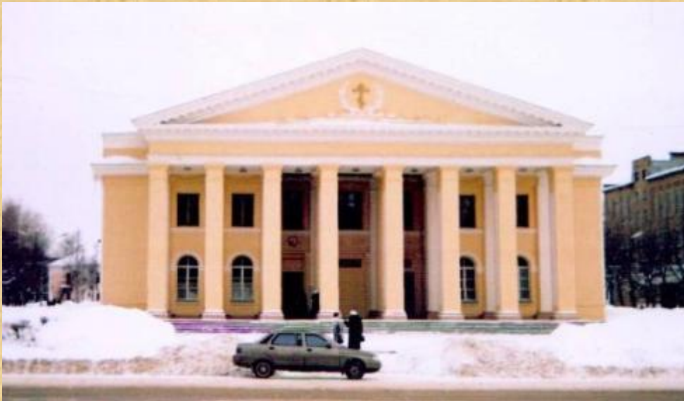
Храм Стефана Пермского.