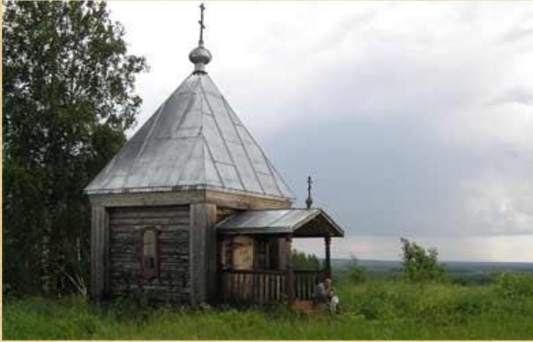
Храм Стефана Пермского.