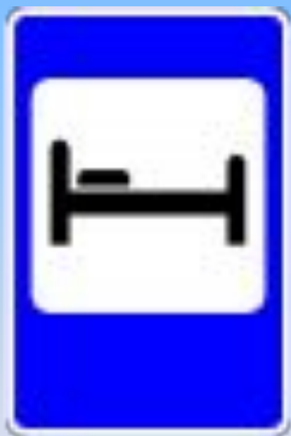
Гостиница или мотель

Место, где можно Поспать, отдохнуть И с новыми силами Двинуться в путь.