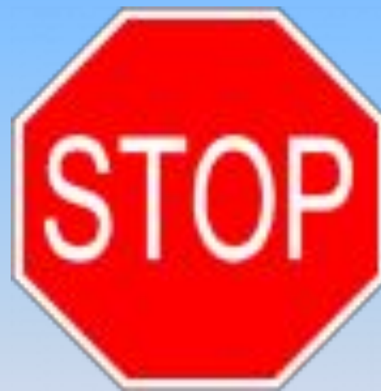
движение без остановки запрещено