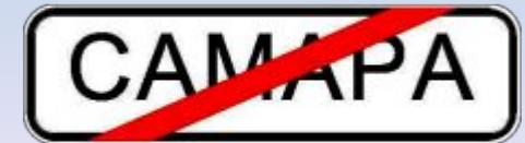
Конец населенного пункта