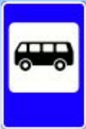
Место остановки автобуса и (или) троллейбуса