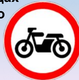
Движение мотоциклов запрещено