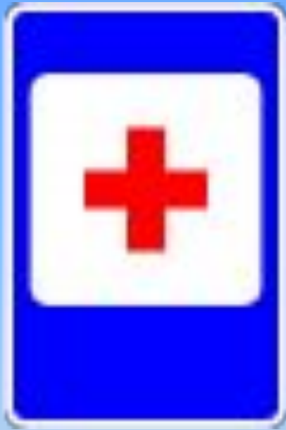
Пункт медицинской помощи