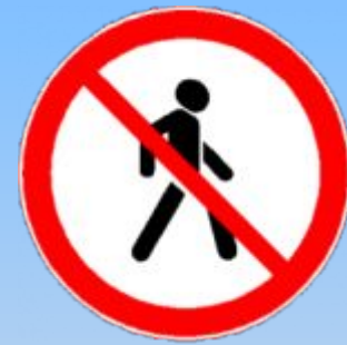
Движение пешеходов запрещено