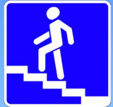
Надземный пешеходный переход