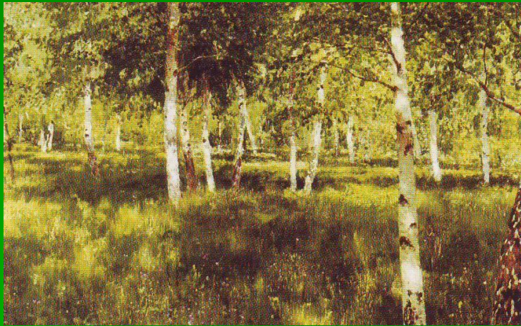
И.И.Левитан «Березовая роща»