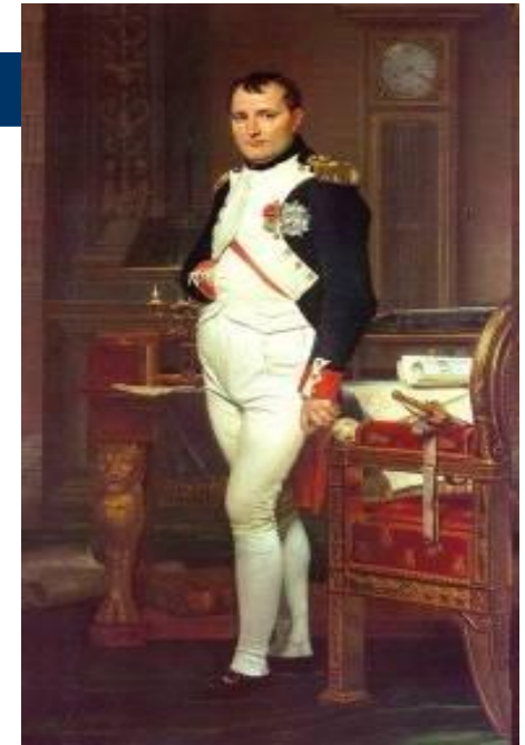
Наполеон Бонапарт (Франция)

Отечественная война 1812 года— война между Россией и наполеоновской Францией на территории России в 1812 году. Причинами войны стали отказ России активно поддерживать континентальную блокаду, в которой Наполеон видел главное оружие против Англии, а также политика Наполеона в отношении европейских государств.