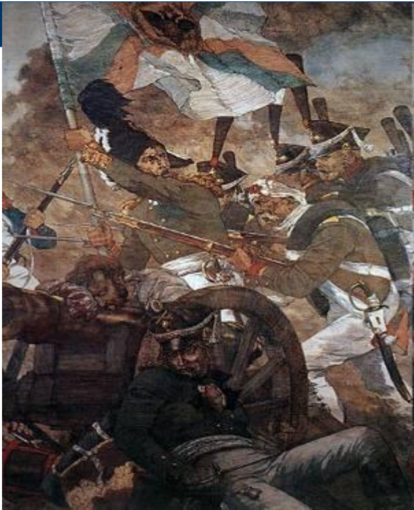
Подвиг генерала Тучкова А.А.