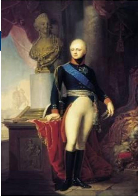
Император Александр I (Россия)

Отечественная война 1812 года— война между Россией и наполеоновской Францией на территории России в 1812 году. Причинами войны стали отказ России активно поддерживать континентальную блокаду, в которой Наполеон видел главное оружие против Англии, а также политика Наполеона в отношении европейских государств.