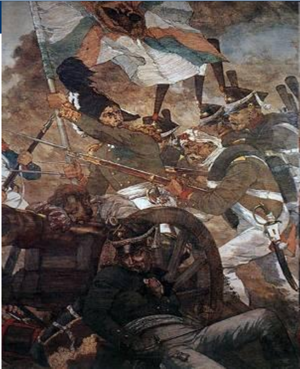
Подвиг генерала Тучкова А.А.