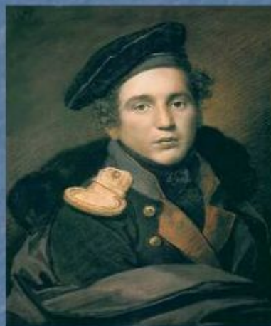
«Портрет П.А. Оленина»