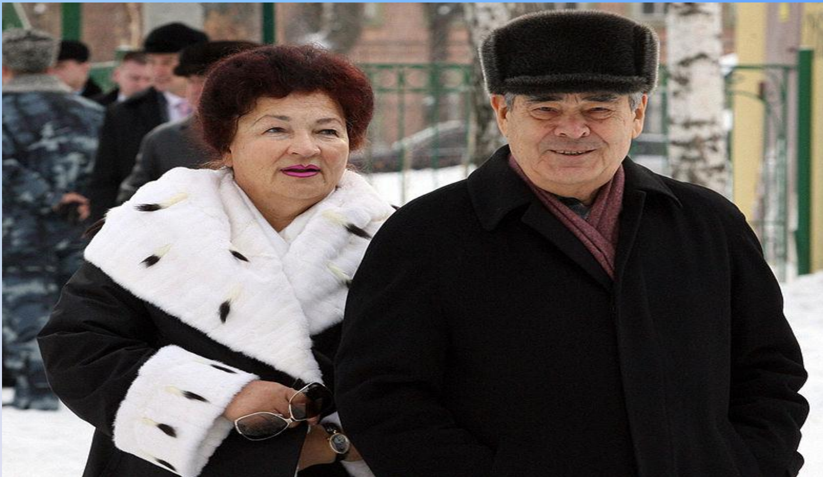
Минтимер Шаймиев хатыны Сәкинә апа белән