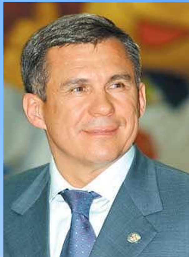
Татарстанның хәзерге Президенты -Минниханов Рәстәм Нурғалиевич