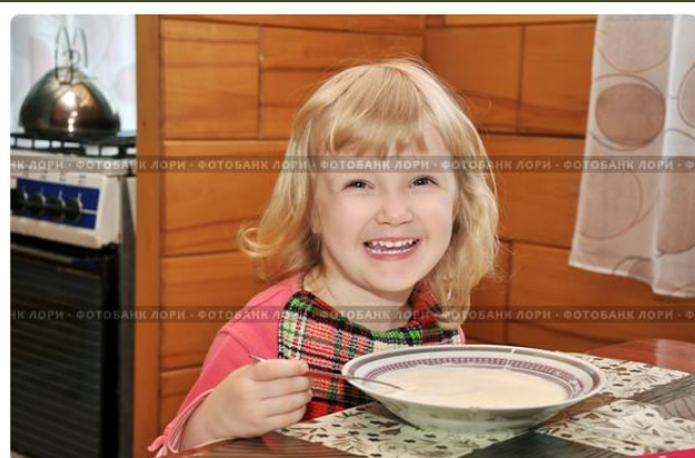
Трехлетняя девочка ест кашу на завтрак