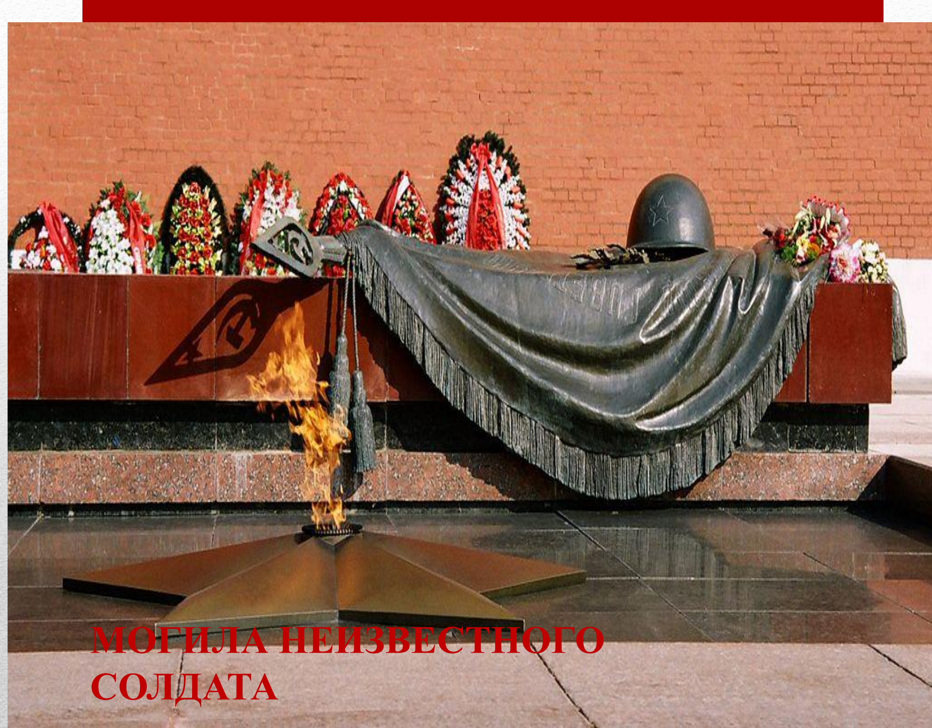
МОГИЛА НЕИЗВЕСТНОГО СОЛДАТА