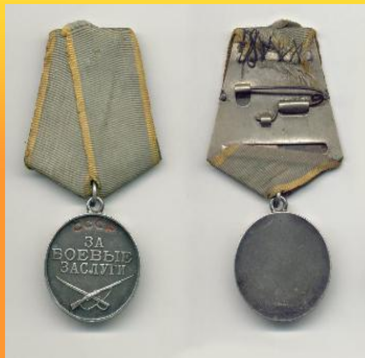
Медаль за боевые заслуги