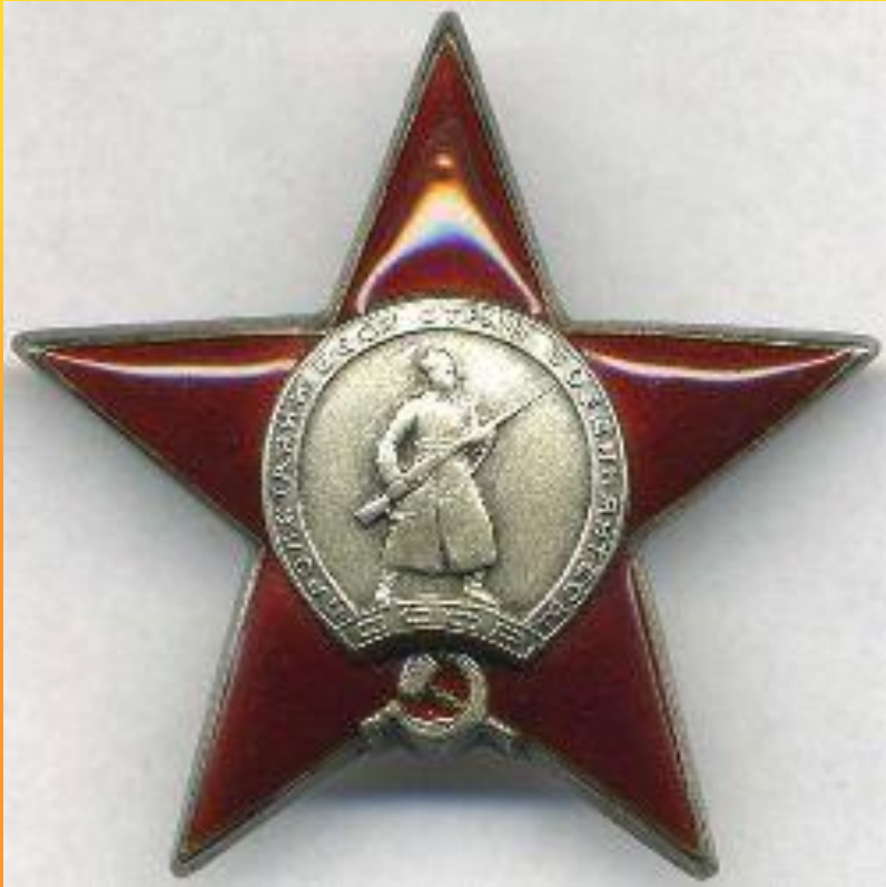
Орден красной звезды