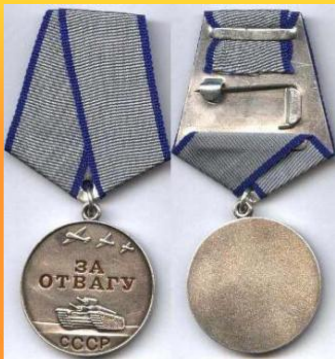
Медаль за отвагу

За героизм и подвиги на войне, солдаты награждались орденами и медалями.