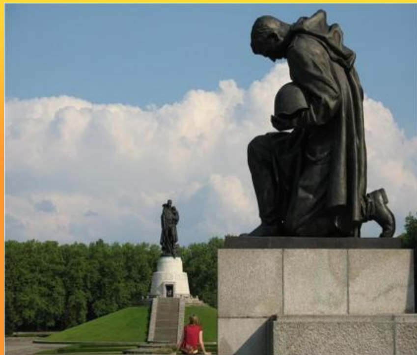
Памятник воинам Советской Армии павшим в боях с фашизмом.