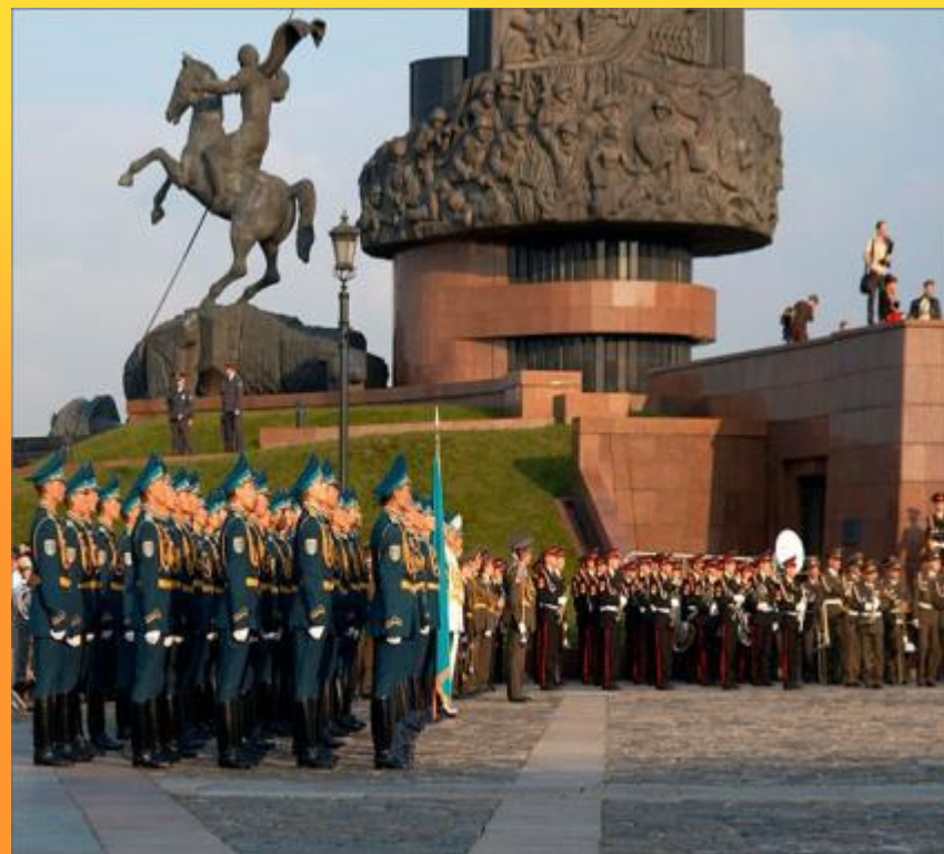
Поклонная гора в Москве