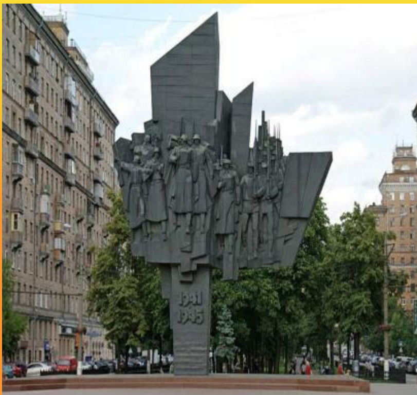
Монумент- «Защитники Москвы»