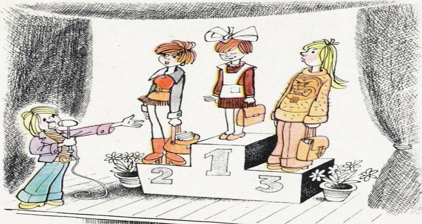
Рисунок Б. ВОРОБЬЕВА

— Победителем нашего школьного конкурса на самый оригинальный костюм для занятий стала первоклассница Маша Иванова!