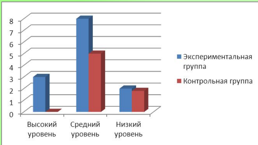
Рис.2. Сравнительные результаты развития словаря у детей экспериментальной и контрольной групп