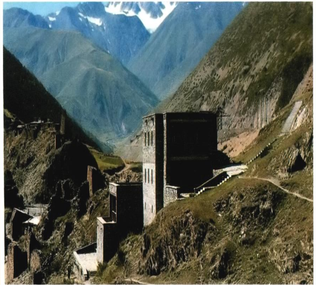
Аул Нар. Музей Коста Хетагурова