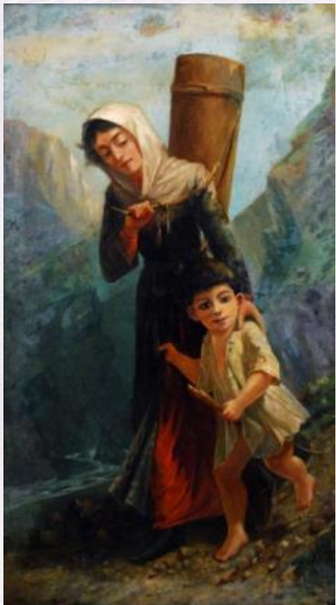
«Горянка, идущая за водой»