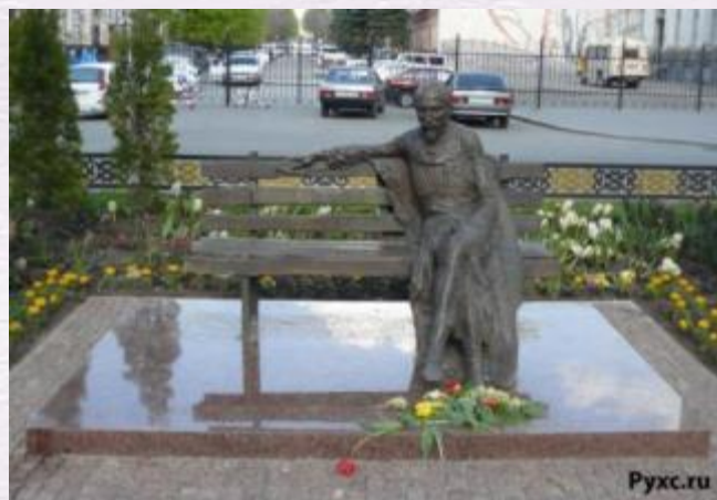
г. Владикавказ пр. Мира