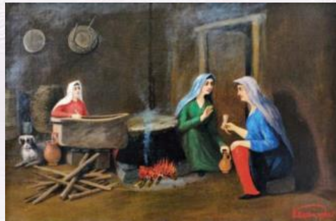
«В осетинской сакле»