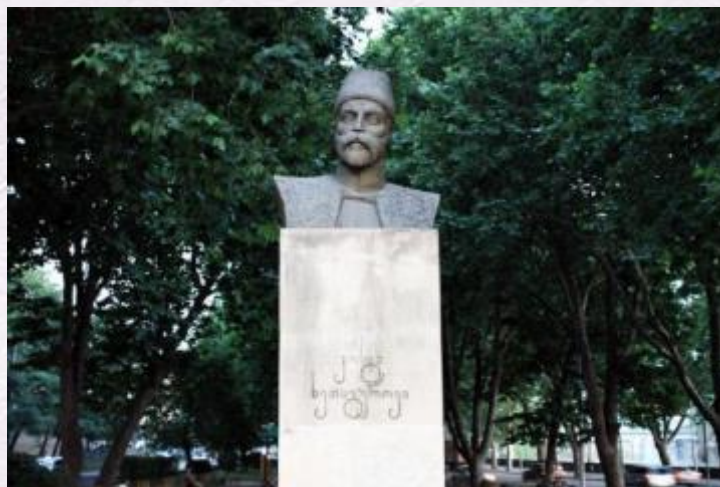
в Тбилиси есть памятник Коста Хетагурову