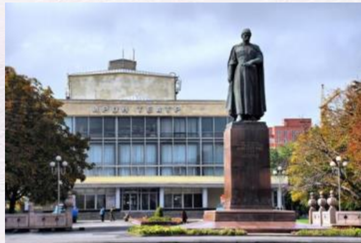
г. Владикавказ перед осетинским театром