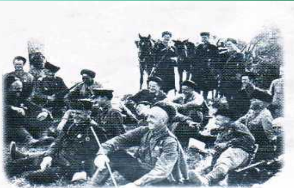
Бойцы 4-го Кубанского гвардейского кавалерийского корпуса на привале. 1942 г.

По просьбе казаков на Кубани был организован кавалерийский казачий корпус, а в нашем Гулькевичском районе была создана казачья сотня