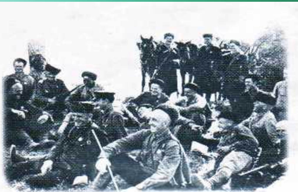
Бойцы 4-го Кубанского гвардейского кавалерийского корпуса на привале. 1942 г.

По просьбе казаков на Кубани был организован кавалерийский казачий корпус, а в нашем Гулькевичском районе была создана казачья сотня