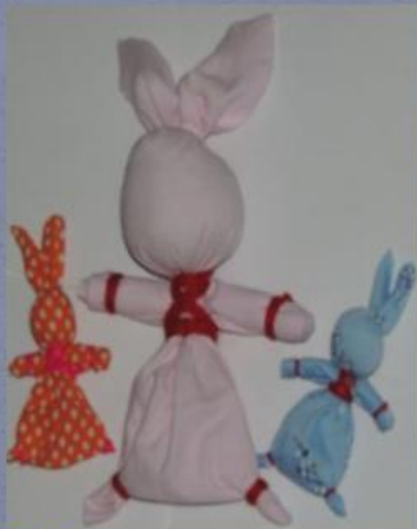
«Зайчик на пальчик»