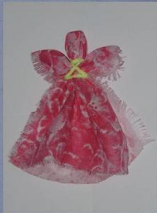
«Отдарок на подарок»