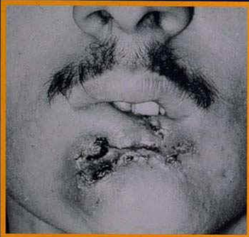
A fatal mouth cancer in a 28-year-old who dipped a can a day for 10 years.