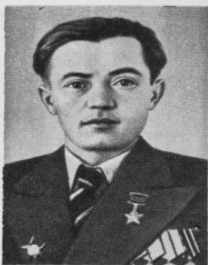
Я. Ф. Павлов