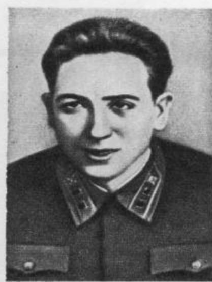
Р. Р. Ибаррури