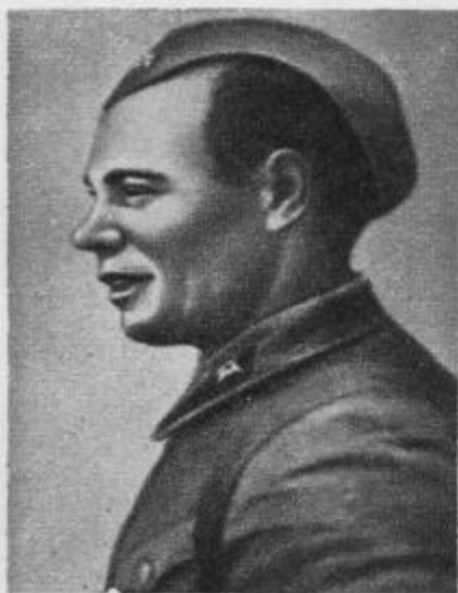
П. О. Болото