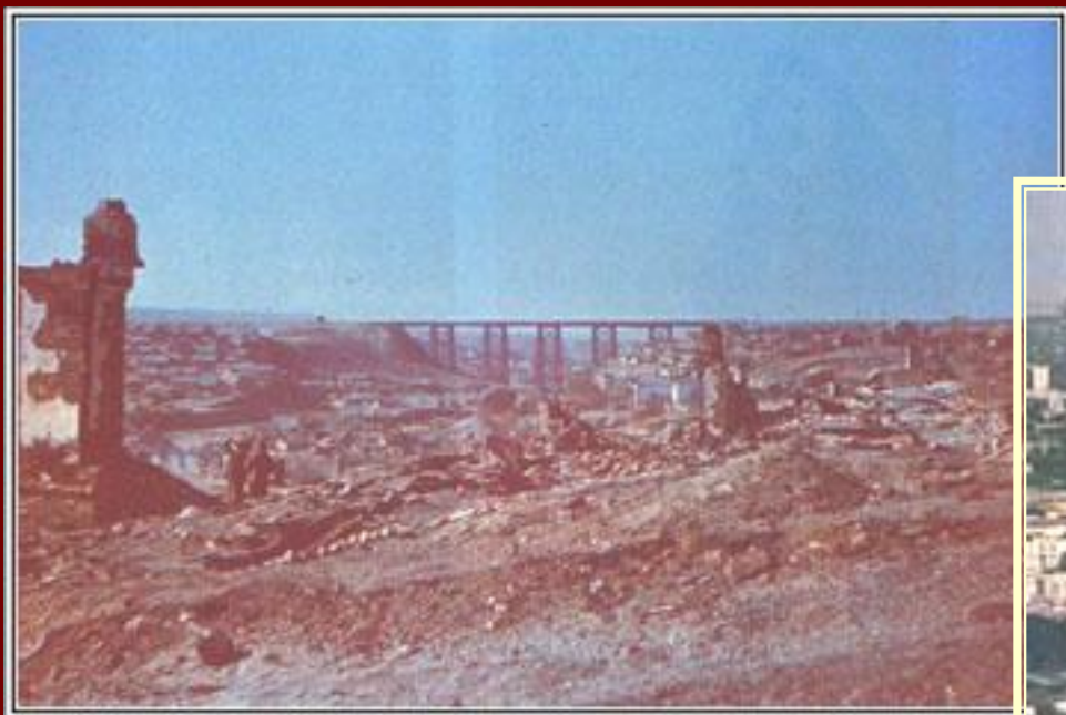
Разрушения в Сталинграде, октябрь 1942г.