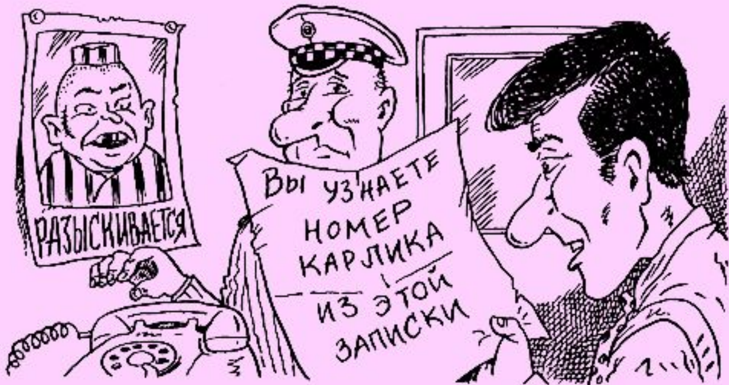
городе телефонные номера со