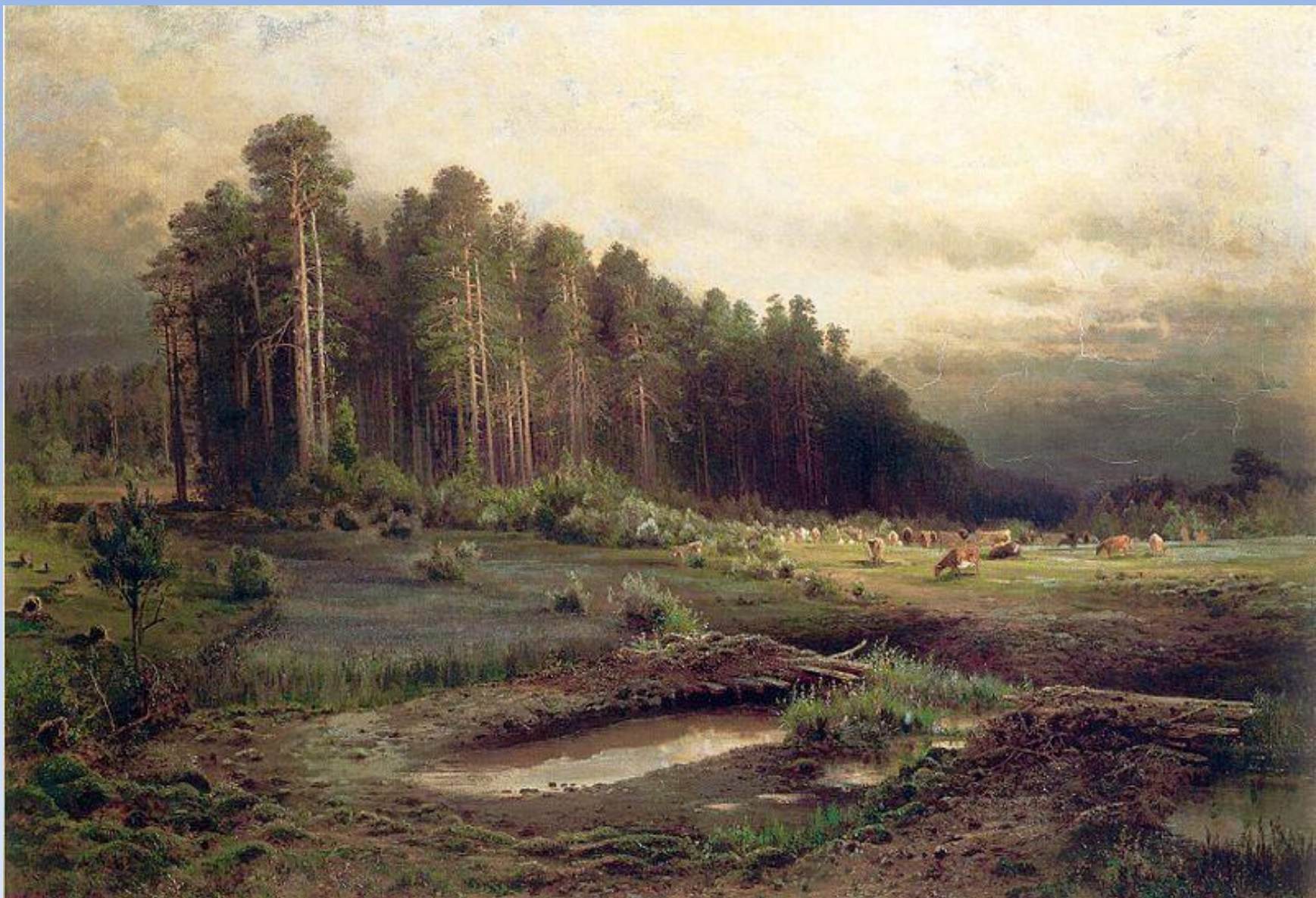
Алексей Саврасов. Лосинный остров в Сокольниках, 1869