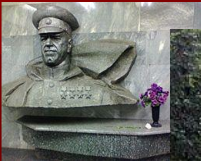
Бюст Жукова в метро Харькова