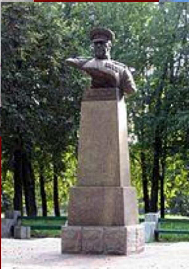
Памятник Жукову в Минске