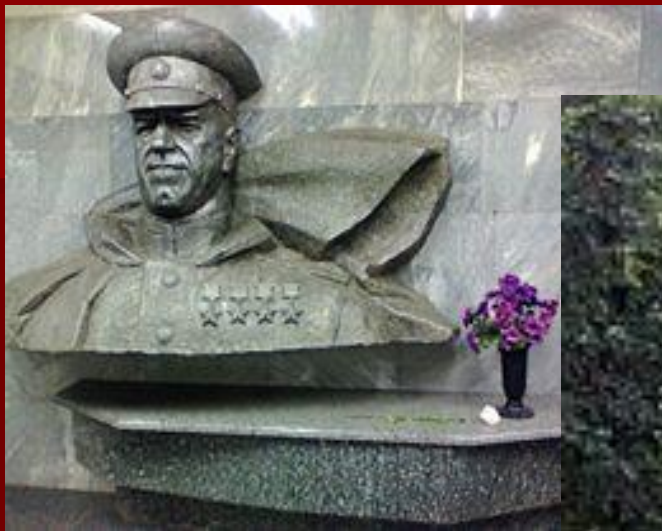
Бюст Жукова в метро Харькова