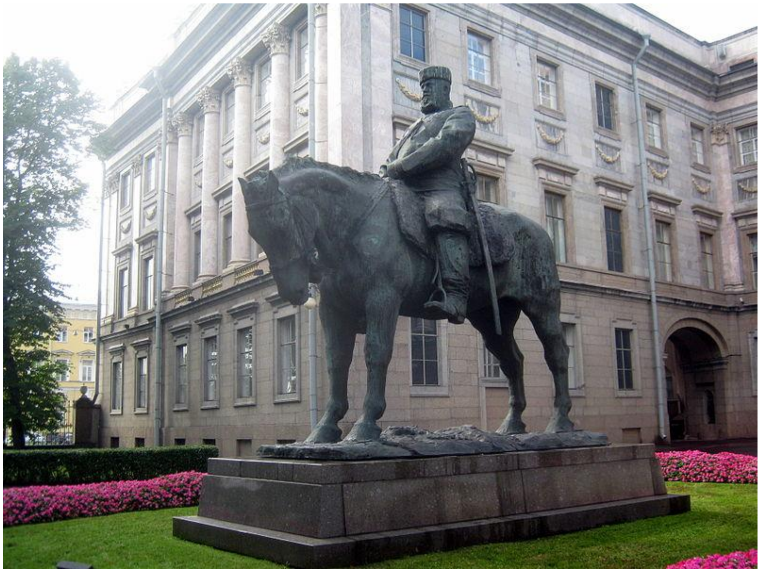
Памятник Александру III во дворе Мраморного дворца