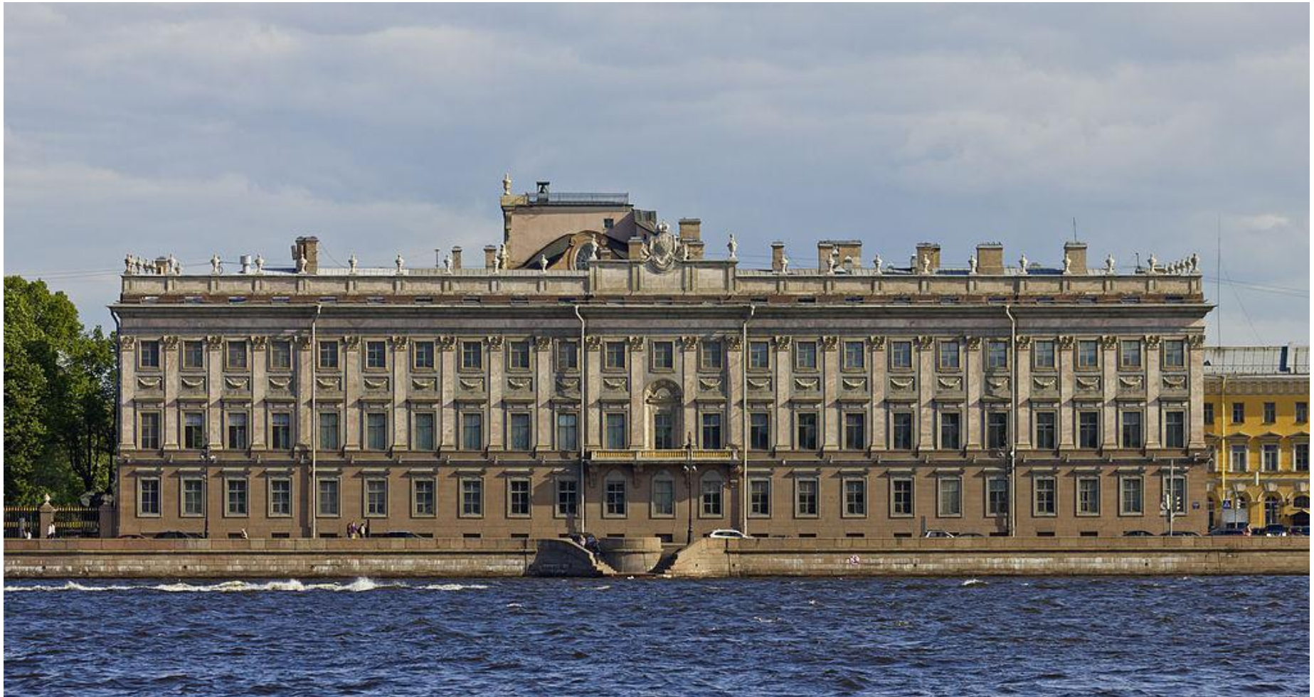
Мраморный дворец ( середина XVIII арх. А.Ринальди)