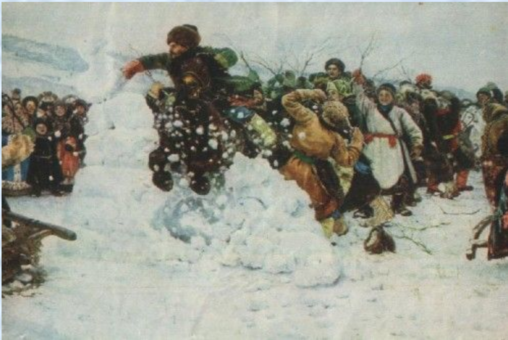
Суриков В. И. Взятие снежного городка. 1891г.