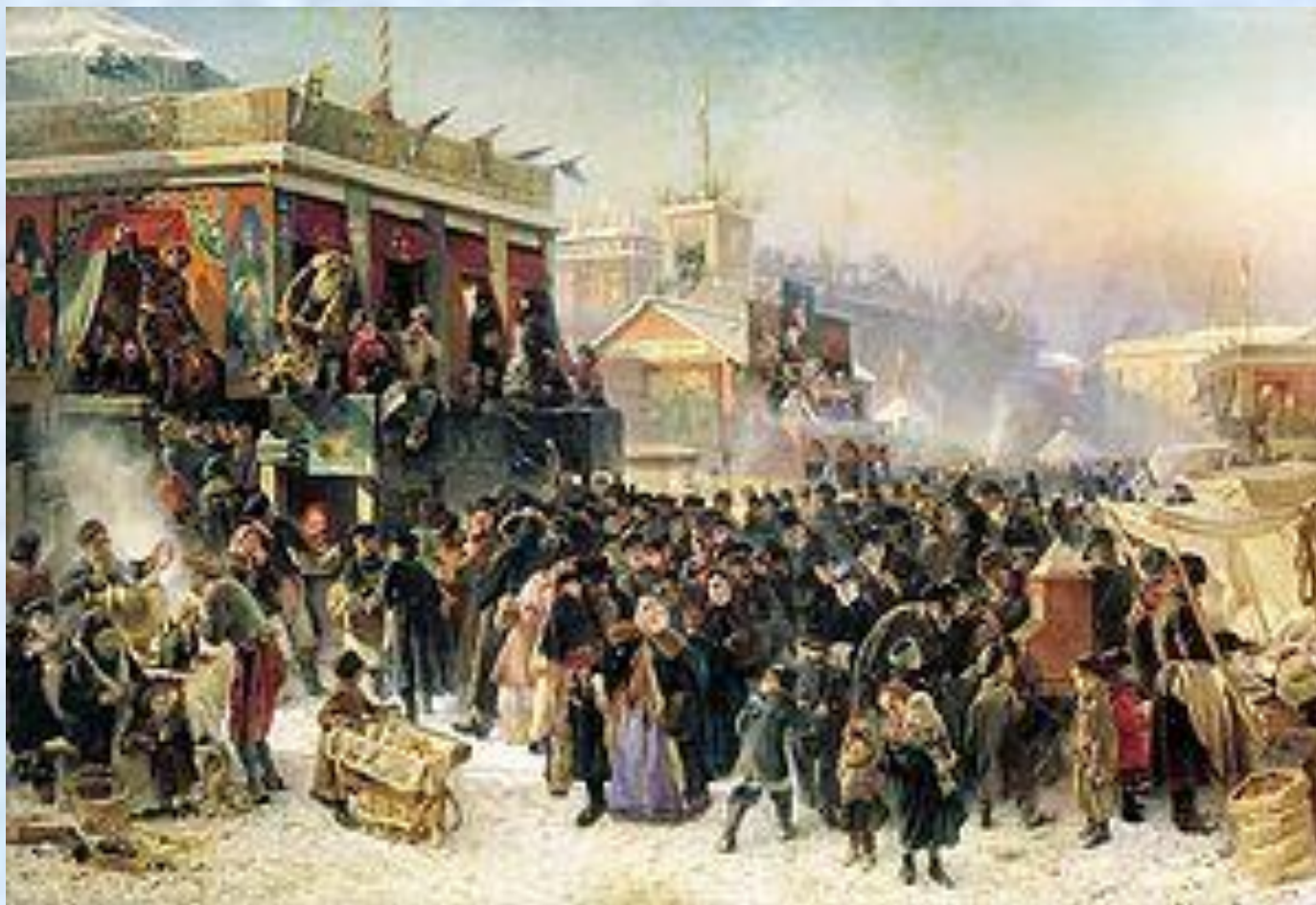
«Народное гулянье во время масленицы на Адмиралтейской площади в Петербурге». Маковский К. Е. 1869.